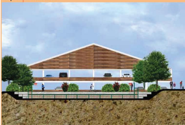
Coupe du stationnement

La particularité principale de ce quartier réside dans le secteur des déplacements. En effet, il a été décidé du report du stationnement à la parcelle vers des halles de stationnement collectives. Les voies de desserte et les parcelles seront ainsi libérées de l'emprise des voitures au profit d'une meilleure qualité de vie et d'une sécurité accrue pour les modes doux et les habitants. Cela permettra également un développement de l'usage de la navette communale.